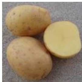
PATATE PASTA GIALLA